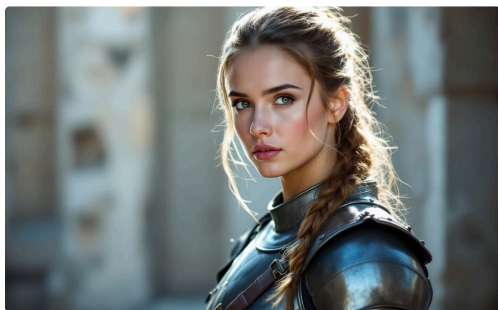
Joan of Arc

Personagem em "The Adventures of Tintin"