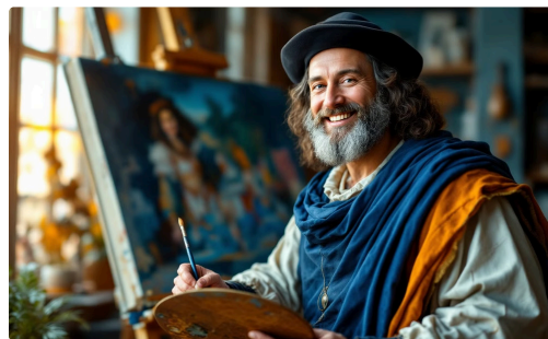
Leonardo da Vinci

Personagem em "The Adventures of Tintin"